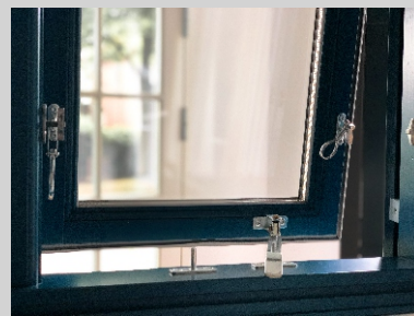
TOPGESTEUERT MIT AUSTELL- STANGE & ANWERFERN