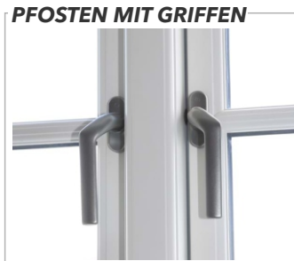
PFOSTEN MIT GRIFFEN