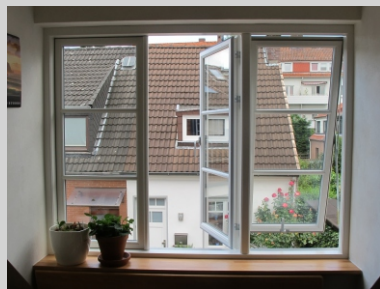
SEITENGEHÄNGT [MITTE] TOPGESTEUERT MIT GRIFF [RECHTS]